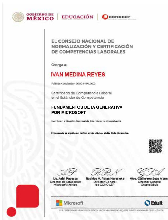
MUESTRA DEL CERTIFICADO