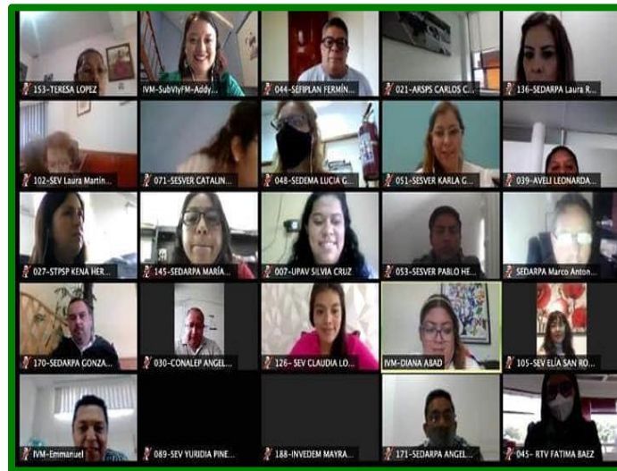
Captura de asistentes de las capacitaciones y talleres en Línea “Implementación de la perspectiva de género en acciones y programas públicos de la Administración Pública Estatal”, “Formulación de presupuestos sensibles al Género en la Administración Pública Estatal” y “Asesoría en indicadores de PBR que incidan en la Igualdad”.

Así mismo de forma conjunta y coordinada con el Instituto Veracruzano de las Mujeres se gestionó y se participó en los talleres y capacitaciones dirigidos a las áreas de planeación, recursos financieros y presupuestos de esta Dirección General, titulados “Implementación de la perspectiva de género en acciones y programas públicos de la Administración Pública Estatal”, “Formulación de presupuestos sensibles al Género en la Administración Pública Estatal” y “Asesoría en indicadores de PBR que incidan en la Igualdad”, todos estos con la finalidad de dar cumplimiento a la Ley para la Igualdad entre mujeres y hombres para el Estado de Veracruz, en sus artículos 13,14,15,16 y 17, este ultimo referentes a todas las dependencias ,deben garantizar y prever el cumplimiento de programas “Garantizando que la planeación de presupuestos incorporen la perspectiva de género, apoye la transversalidad y prever el cumplimiento de programas, proyectos para la igualdad entre mujeres y hombres, “Eficientando el presupuesto estatal, con enfoque de derechos humanos, enfatizando la perspectiva de género, así mismo determinar indicadores del presupuesto 2021 que incidan en la igualdad de género.