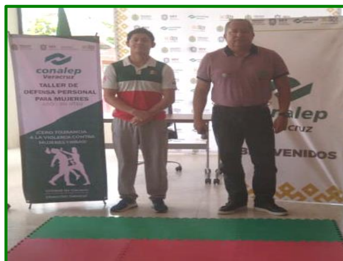
Presentación e inicio del Taller de Defensa Personal y Derechos Humanos a la Comunidad Conalep a través de la Plataforma de Microsoft Teams.

Siguiendo con la Difusión de nuestro taller institucionalizado de defensa personal y derechos humanos en coordinación con la Secretaría de Educación de Veracruz, a través de la Subsecretaria de Educación Media Superior y Superior, con la coordinación con los departamentos de artísticas y deporte, se llevaron a cabo, videoconferencias en línea para toda la comunidad educativa del Estado de Veracruz, así mismo, con capsulas que pronto se estarán difundiendo. En el mismo tenor, se impartió el presente taller a toda la comunidad CONALEP, dirigido a alumnas, alumnos, personal administrativo, docente y padres de familia, con la finalidad de seguir dotando de herramientas teóricas y practicas sobre la importancia de erradicar la violencia contra las mujeres y niñas, los derechos humanos y el principio de Conalep que es la Igualdad, todo esto, a través de actividades lúdicas del deporte del judo.