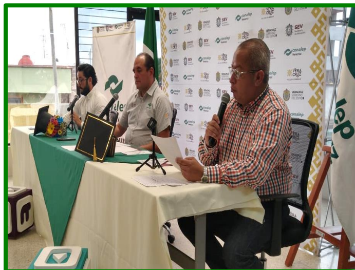
Clausura de la Jornada de Capacitación Social del Colegio, en especial del taller virtual a-b-c de la igualdad.