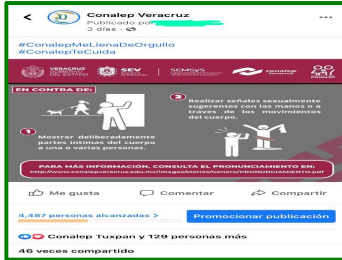
Captura de pantalla de la difusión a través de las redes institucionales (Facebook) sobre el Protocolo de Prevención, Atención y Sanción del Hostigamiento Sexual y Acoso Sexual en la Administración Pública Estatal.