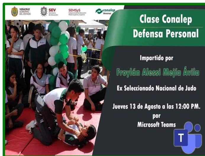
Cartel de difusión para las redes institucionales del Taller de Defensa Personal y Derechos Humanos a la Comunidad Conalep a través de la Plataforma de Microsoft Teams.