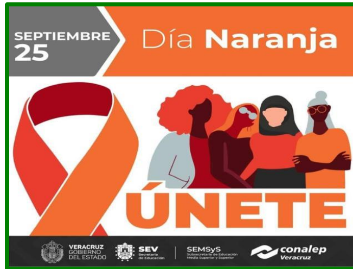
Cartel de difusión sobre la conmemoración de los días naranja, para las redes institucionales.