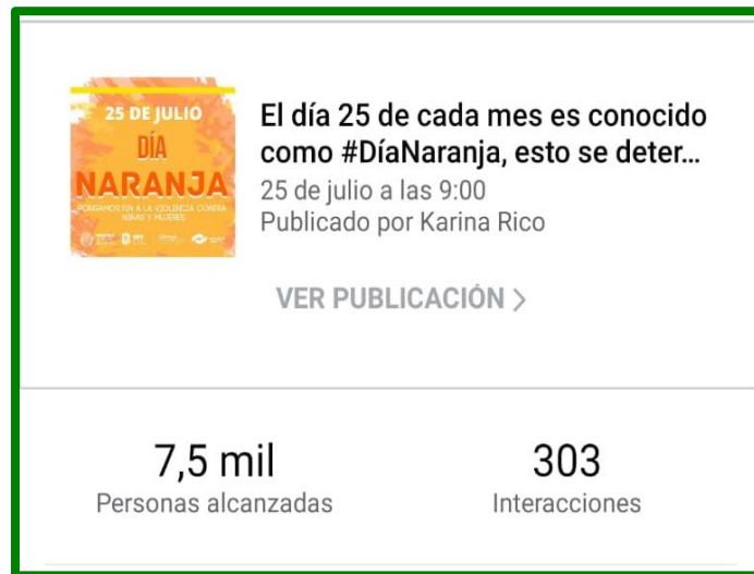
Cartel de difusión sobre la conmemoración de los días naranja, para las redes institucionales y sus alcances.