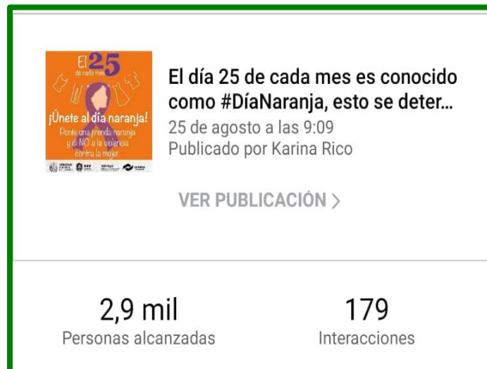
Cartel de difusión sobre la conmemoración de los días naranja, para las redes institucionales y sus alcances.

Siguiendo con la Difusión de nuestro taller institucionalizado de defensa personal y derechos humanos en coordinación con la Secretaría de Educación de Veracruz, a través de la Subsecretaria de Educación Media Superior y Superior, con la coordinación con los departamentos de artísticas y deporte, se llevaron a cabo, videoconferencias en línea para toda la comunidad educativa del Estado de Veracruz, así mismo, con capsulas que pronto se estarán difundiendo. En el mismo tenor, se impartió el presente taller a toda la comunidad CONALEP, dirigido a alumnas, alumnos, personal administrativo, docente y padres de familia, con la finalidad de seguir dotando de herramientas teóricas y practicas sobre la importancia de erradicar la violencia contra las mujeres y niñas, los derechos humanos y el principio de Conalep que es la Igualdad, todo esto, a través de actividades lúdicas del deporte del judo.