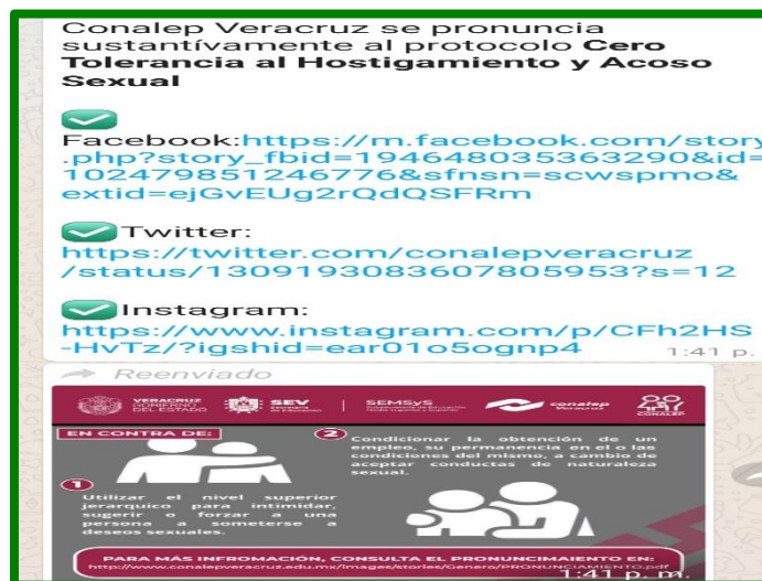
Captura de pantalla de la difusión a través de las redes institucionales (Whats App) sobre el Protocolo de Prevención, Atención y Sanción del Hostigamiento Sexual y Acoso Sexual en la Administración Pública Estatal.

Conmemoración de los Días Naranja de forma virtual como parte de una gran campaña UNETE-DÍA NARANJA, puesto en marcha por la ONU, con el objetivo de generar conciencia para prevenir y erradicar la violencia contra mujeres y niñas.