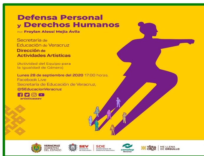
Cartel de difusión para las redes institucionales del Taller de Defensa Personal y Derechos Humanos a la Comunidad Educativa de la Secretaría de Educación de Veracruz a través de Facebook Live de la misma.

Finalmente, esta Unidad de Género participo en el taller de Derechos Humanos en México, derecho a la Igualdad y No Discriminación, Derechos de niñas, niños y adolescentes y Enlázate por la Paz, participando además de forma activa en la capacitación social que nuestro colegio realiza hacia la comunidad, a través de A-B-C de la Igualdad taller virtual.