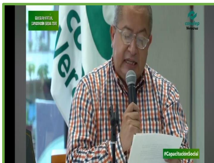
Clausura de la Jornada de Capacitación Social del Colegio, en especial del taller virtual a-b-c de la igualdad.